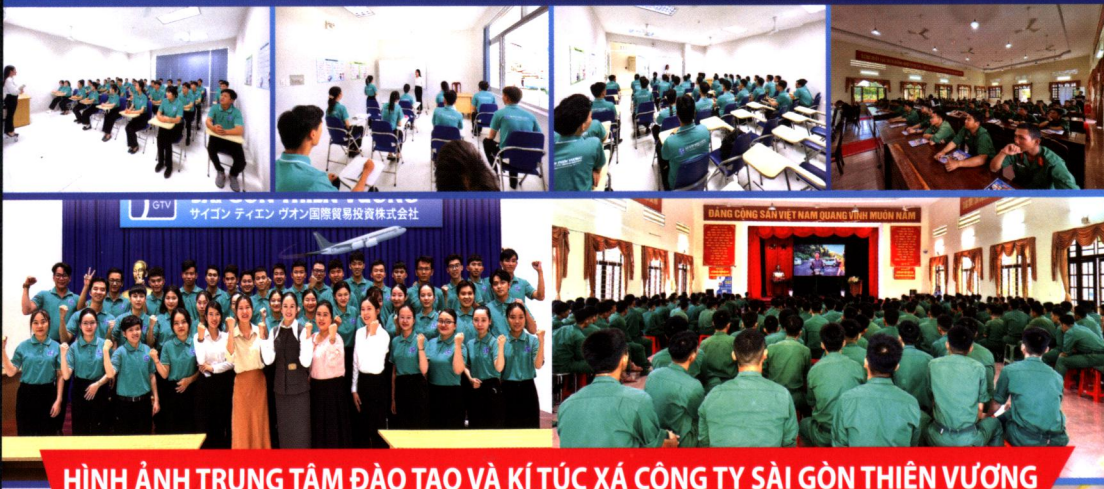
HÌNH ẢNH TRUNG TÂM ĐÀO TẠO VÀ KÍ TỨC XÁ CÔNG TY SÀI GÒN THIÊN VƯƠNG

“CHƯƠNG TRÌNH Ý NGHĨA NHÂN VĂN HƯỚNG ĐẾN CỘNG ĐỒNG TẠO CƠ HỘI ĐỂ HÀNG NGÀN BẠN TRẺ ĐƯỢC HỌC TẬP LÀM VIỆC VÀ TRẢI NGHIỆM TẠI NHẬT BẢN”